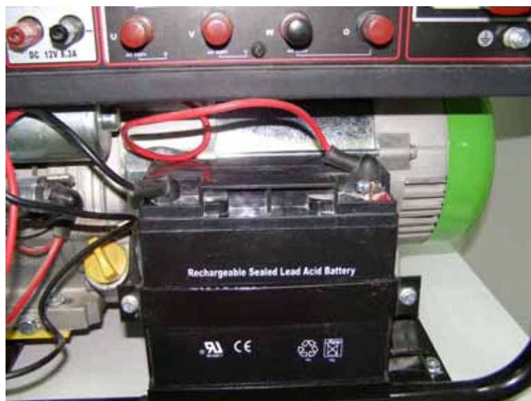
Рис.01. Подключение аккумуляторной батареи к генератору