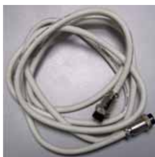
Сигнальный провод. Рис.2