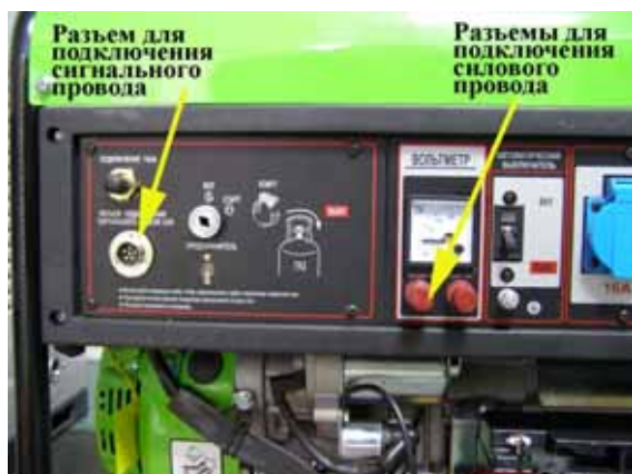
Разъемы подключения на панели генератора. Рис.1

3. Соединить генератор и АПУ через разъемы на генераторе (220В\380В) и АПУ(220\380В) (рис.1, рис.3) используя сигнальный провод (рис.2), входящий в комплект.